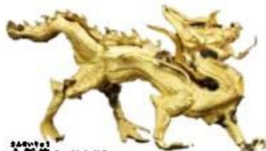
金製龍【一級文物】 浙江省博物館蔵