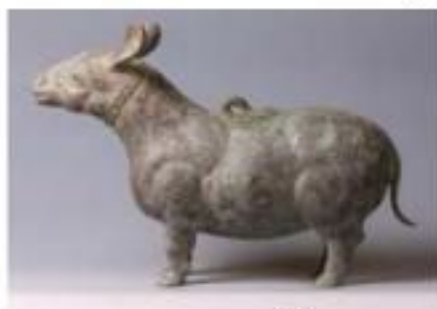
犧尊【一級文物】 山東省・齊國故城遺址博物館蔵