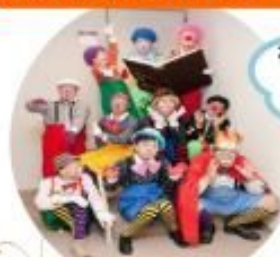
社会福祉法人かがやき神戸 【土曜日の天使たち】

彼らはまさに「微笑みの天使」。障がいのあるメンバーたちのクラウンチーム【土曜日の天使達】は8年に渡るクラウン（道化師）修行の末、誰も真似できない愉快で不思議な世界を作り上げることが出来ました。クラウンとなった彼らにとって、障がいは決してハンディではなく、『彼らの魅力的な個性を表現するための豊かな才能』へと変貌を遂げました。