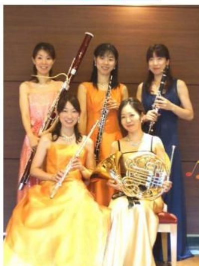
木管五重奏団 アマ・ペルテ