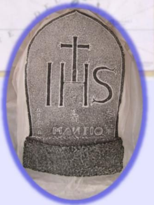
八尾キリシタン墓碑 (1582年銘)